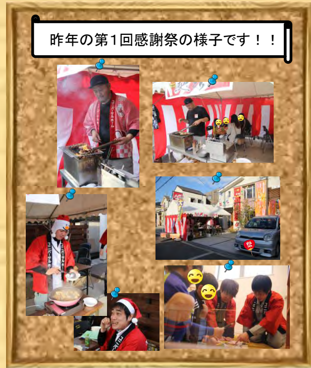
昨年の第1回感謝祭の様子です！！

＜同封の「ご案内」と「返信ハガキ」をご確認ください＞ 今年も事前にご参加の出欠を確認させて頂きたく、大変お手数とは思いますが、返信ハガキの投函をよろしくお願い申し上げます。