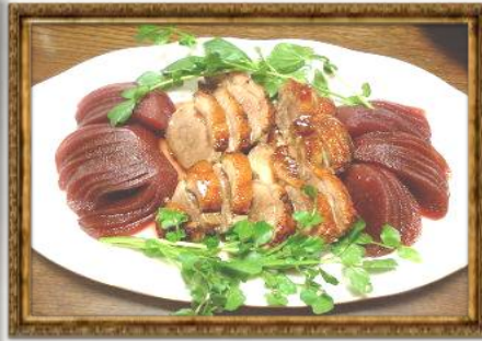
ちょっと面倒だけど美味しい！