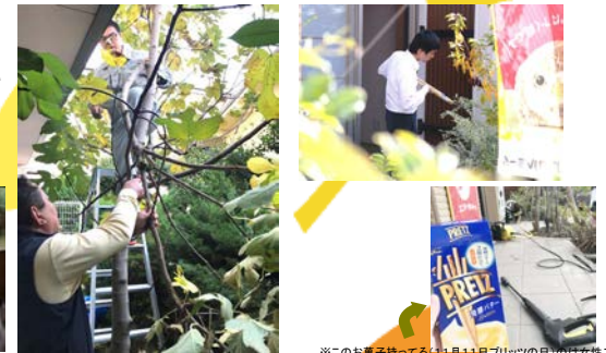
※このお菓子持ってる日11月11日ブリッツの日のは女性スタッフ