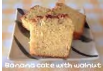
Banana cake with walnut