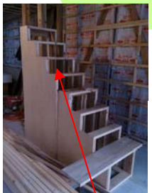
裏から収納できます