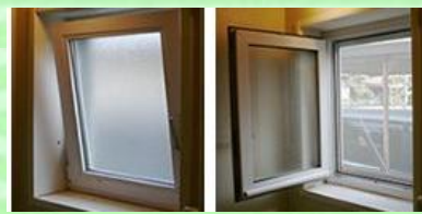
内倒しの時 内開きの時

一般的な内倒し窓に清掃を可能にした商品です。 特殊な構造のためあまり商品化されておらず防火性 を求められている地域などでは現段階ではありません 使い勝手もよく雨仕舞いも良いのでもっと色々出て ほしいですね(*´ー´)