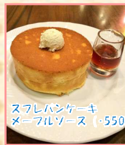
スフレパンケーキ メイプルソース(550)