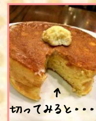
↑ 切ってみると・・・?