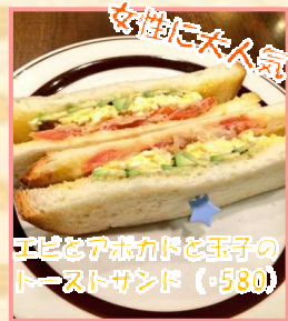
エビとアボカドと玉子のトーストサンド(580)