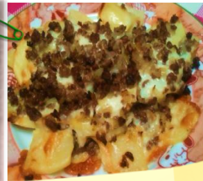
少ない味付けでも美味しい♪